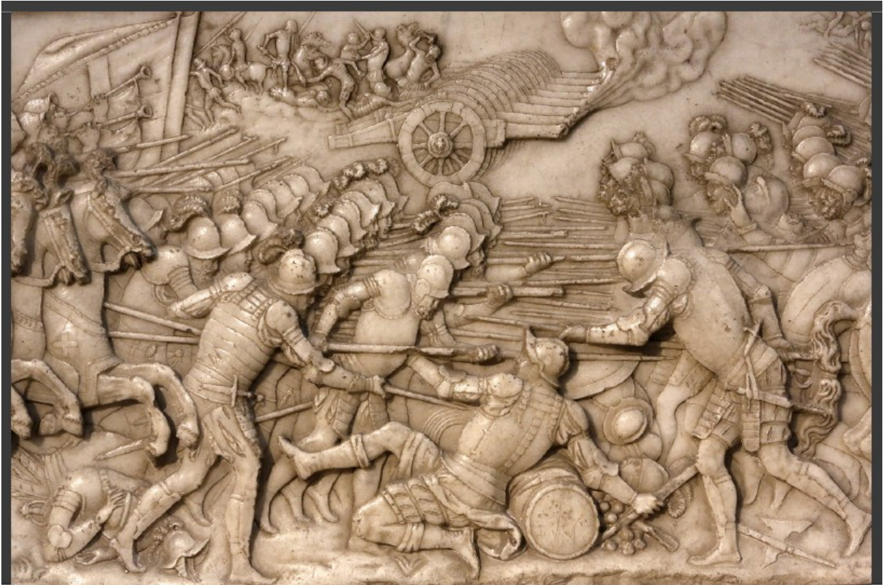
La bataille de Marignan, 1515

Coller dans la barre d'adresse le lien https://www.acces-editions-numeriques.com/ressources_hrv2/sonoresv2/ puis choisir la piste Léonard, ami de François 1 er , année 1519. Répondre aux questions oralement.